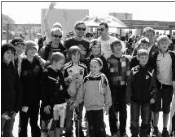
Besuch der Allianz-Arena zum Spiel 1860–Cottbus (4:0)